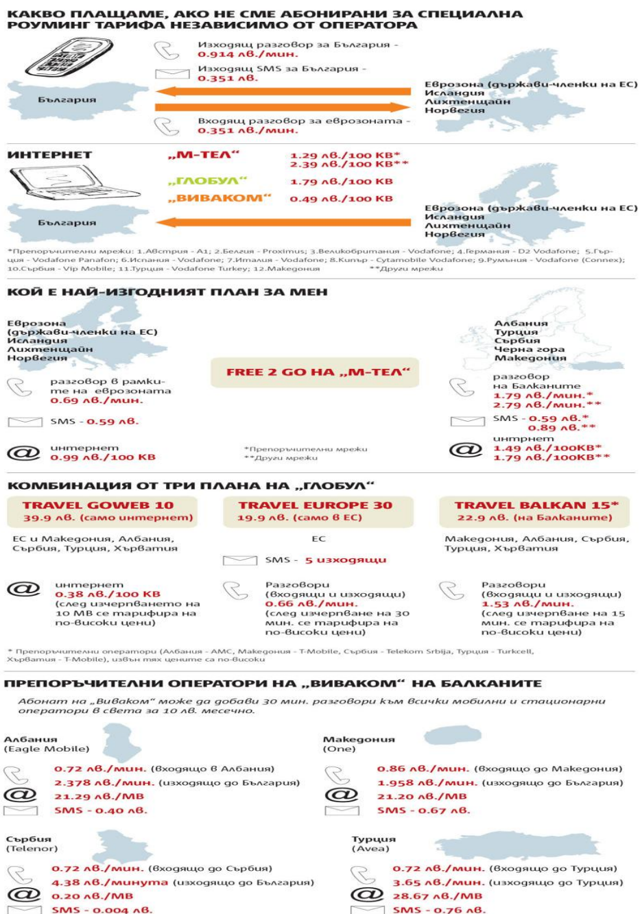
фиг. 6 Графично изображение на цени за външен роуминг, у нас и най-добрите планове и препоръчителни оператори, при посещение на някои от страните в чужбина