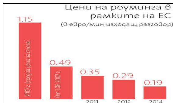
фиг.7 Графично представяне на цени, на външен роуминг, в рамките на ЕС

След две години се очаква да бъде дадена и възможност на клиентите да избират оператор за роуминг, докато са в чужбина. Това означава, че клиент на "М-Тел" например ще може да избере да плаща на "Виваком" или "Глобул", докато е на територията на друга държава от ЕС. В някои случаи намаленията на тарифите за международен (външен) роуминг ще бъдат дори по-големи и ще доближат стойностите, заплащани за услугите на местен оператор, допълниха от администрацията на ЕК. Според тях месечната икономия за бизнесмени, които често пътуват в чужбина, се оценява на около 1000 евро. През идната година се предвижда гражданите на общността да спестят 15 млрд. евро. [2]