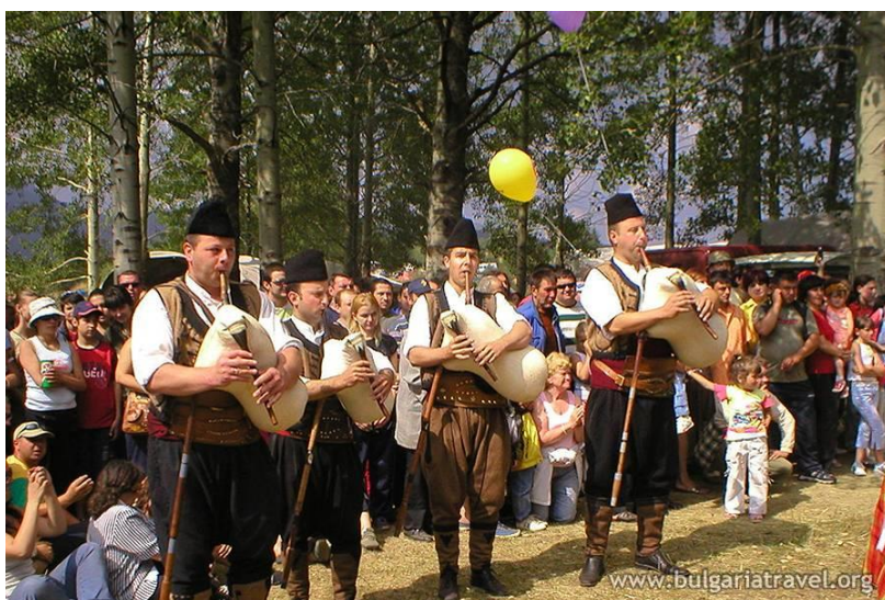
С. Гела ( община Смолян) Международно гайдарско надсвирване

В много села се предлагат повече или по-малко услуги, типични за селския туризъм, съобразно възможностите, традициите и даденостите на съответното селище. Оформят се туристически локации, всяка с нещо специфично, характерно за района и това е добре, защото им създава своеобразен имидж, а туристите имат определена представа и очаквания.