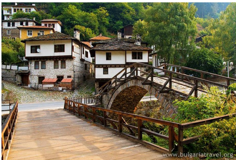
с. Широка лъка ( Родопи)