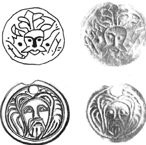
1, 2. Медни пандантиви от Преслав