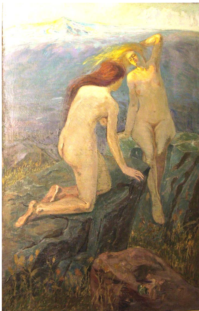
8. "Посрещане на изгрева", ~20-те години, м. б., платно, 158/102. Частно притежание.