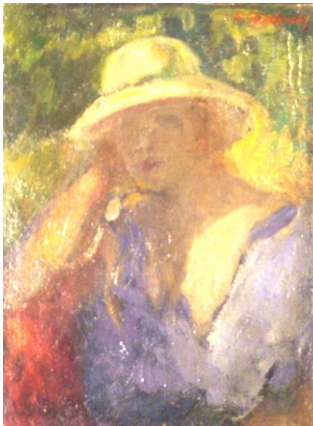
9. “Портрет на жена с шапка”, м. б., платно, 34,5/26. Частно притежание.