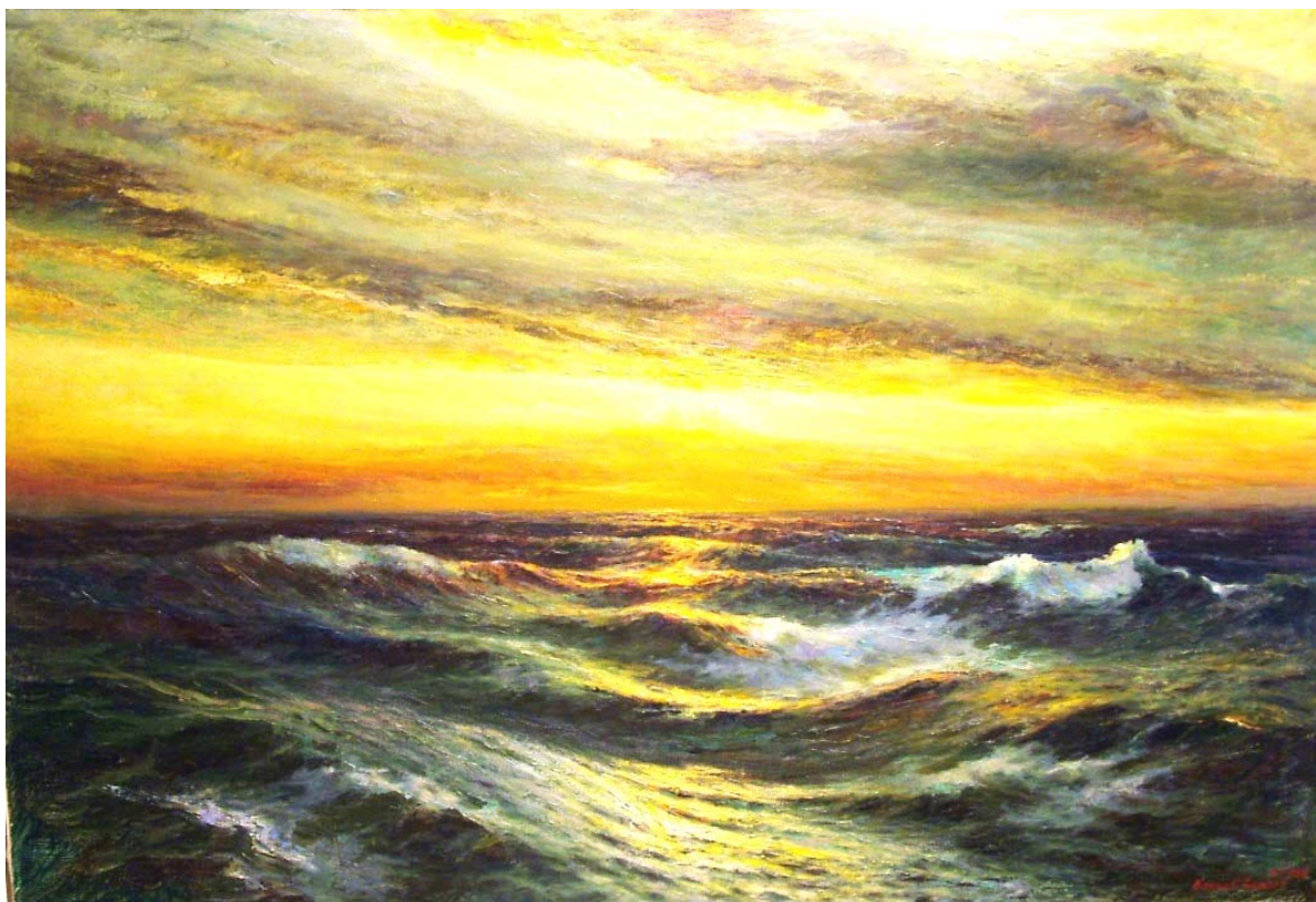
14. “Море”, 1969 г., м. б., платно, 115,5/170,5. Подп., дат.: долу, дясно, червена четка: Борис Стефчев 1969 4.V. Частно притежание.