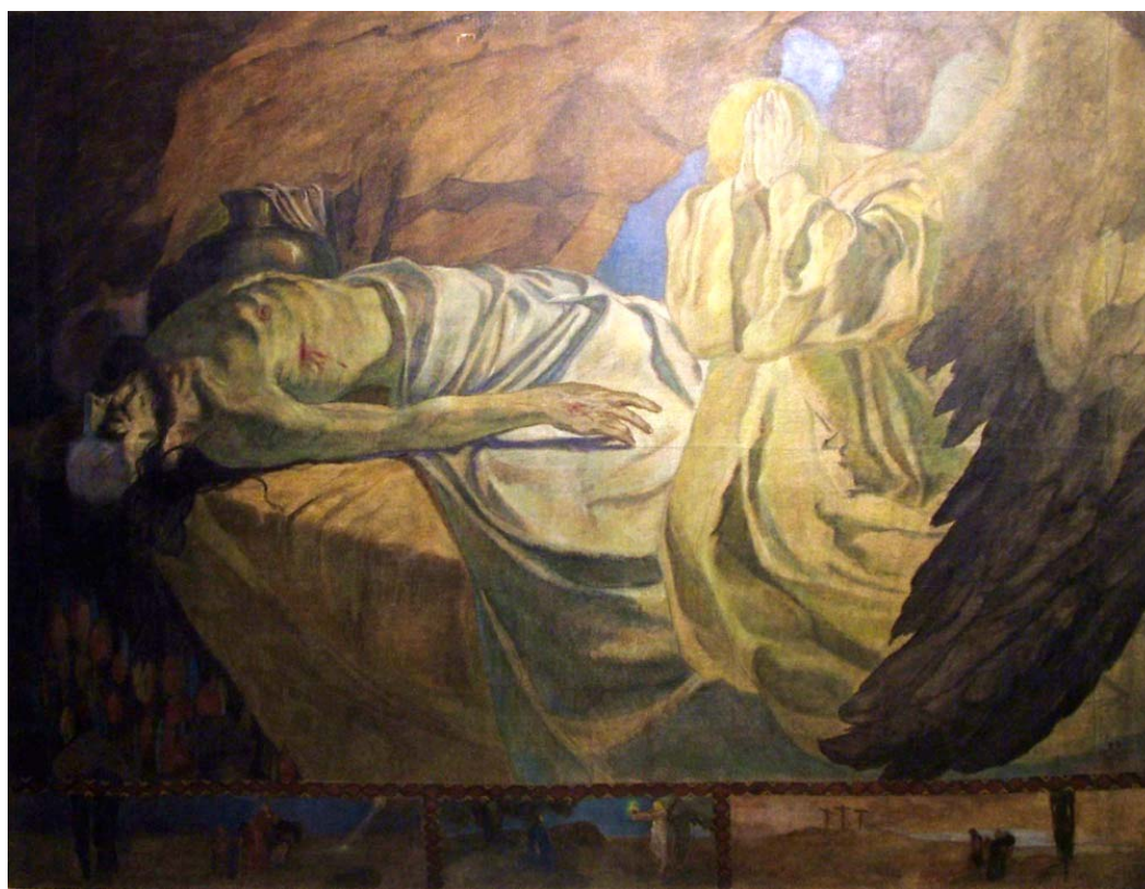
4. “Към гроба Христов”, ~1920 г., м. б., платно, 69/106. Частно притежание.