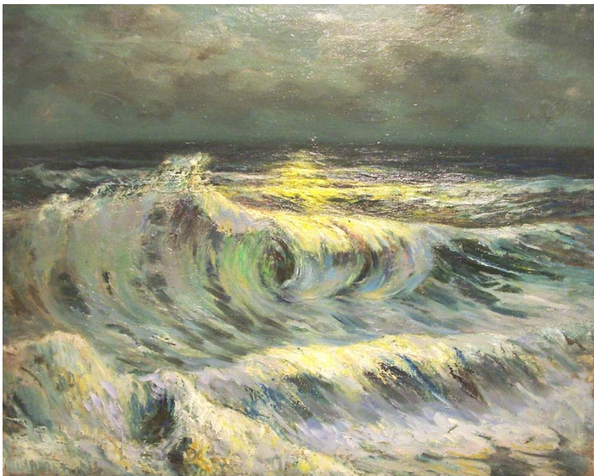
12. “Море”, м. б., платно, 76,5/97,5. Частно притежание.