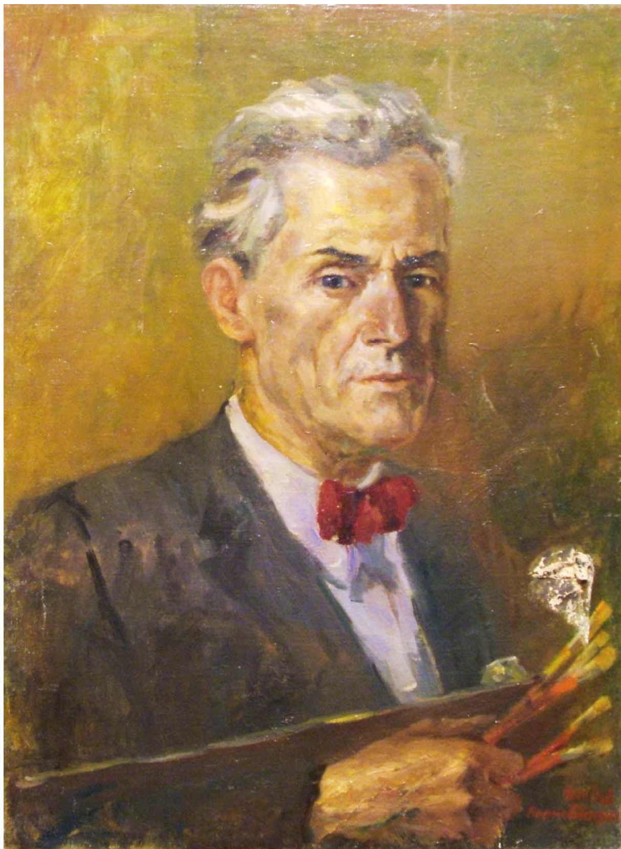
16. "Автопортрет", 1962 г., м. б., платно, 80/60. Подп., дат.: долу, дясно, червена четка: 12 XII 1962 Борис Стефчев. Частно притежание.