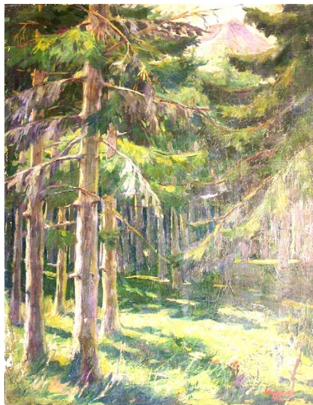
10. “Гора”, 1934 г., м. б., платно, 93,5/73. Подп., дат.: долу, дясно, червена четка: Борис Стефчев 1934. Частно притежание.