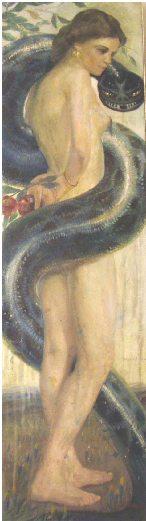
2. "Ева", ~20-те години, м. б., платно, 184/53. Подп. долу, дясно, червена четка : В. Stefchev. Частно притежание.