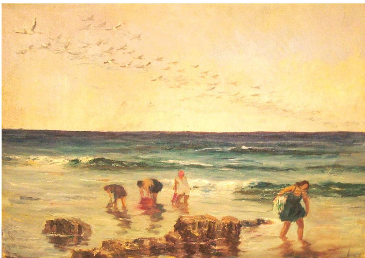
13. “Море, птици и четири женски фигури”, м. б., картон, 50/70. Частно притежание.