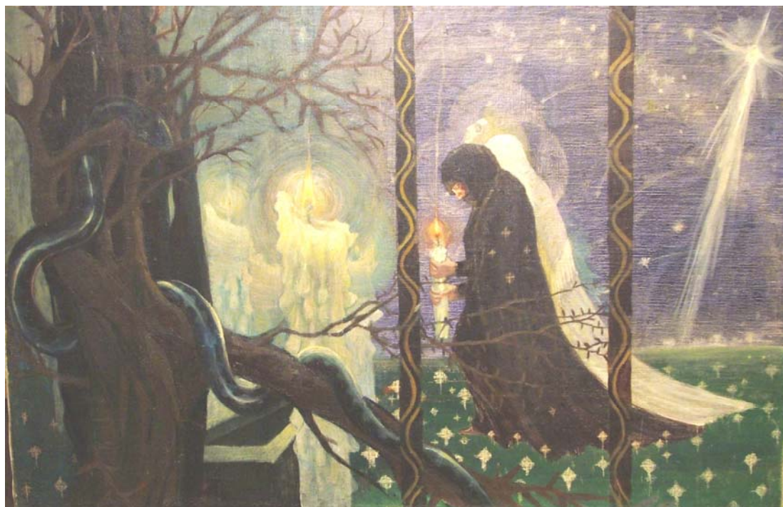
5. „Оплакване Христово”, 1920 г., м. б., платно, 140,5/187. Частно притежание.