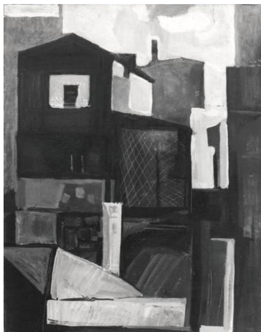
3. Пейзаж–Райково, 1969, масло, платно, 95/75; юбилейна ОХИ 1969.