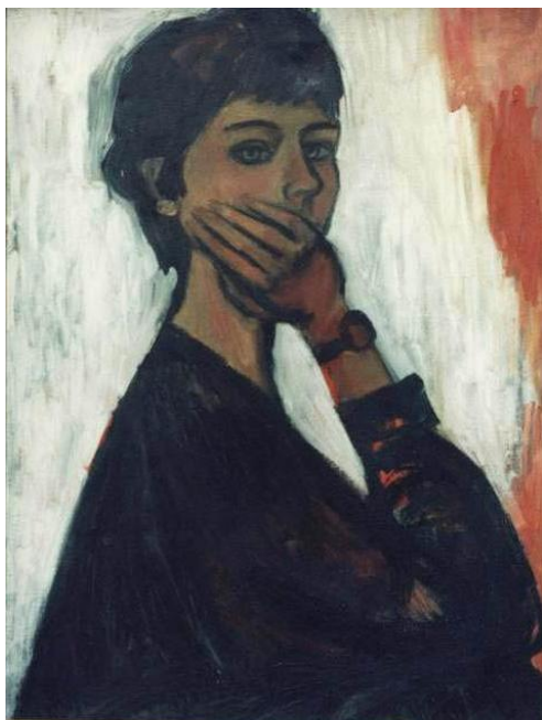
2. Автопортрет, 1962, масло, платно, 49,5/64,5; НХГ, инв. №222 IV, откупена от ДПК 1963г.