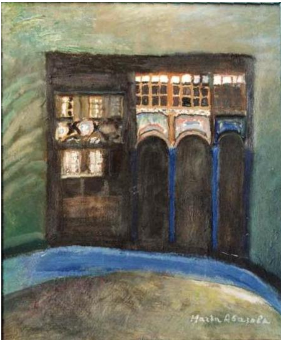
1. Копривщица, 1961, хартия каширана, картон, 54/48; подписана, от 2004 г., частно притежание.