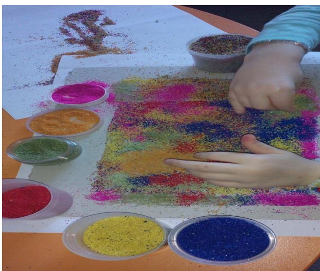
фигура 3 "Днес съм"