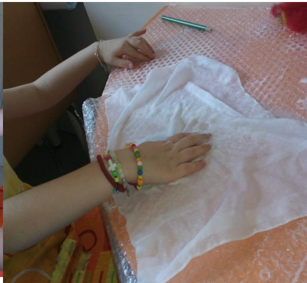
фигура 2 "Щастие"