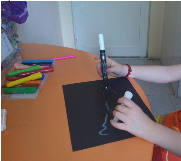
фигура 1 Спонтанна рисунка